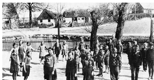
Eleverne fra ca. 1940

Vi fik en grundig indføring i skoleforholdene og kom omkring alle gårdene og købmændene, samt ikke mindst savværket med dets skiftende funktioner, som f. eks. økseskaft- og trillebørsfabrik.