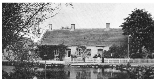
Skolen fra 1881